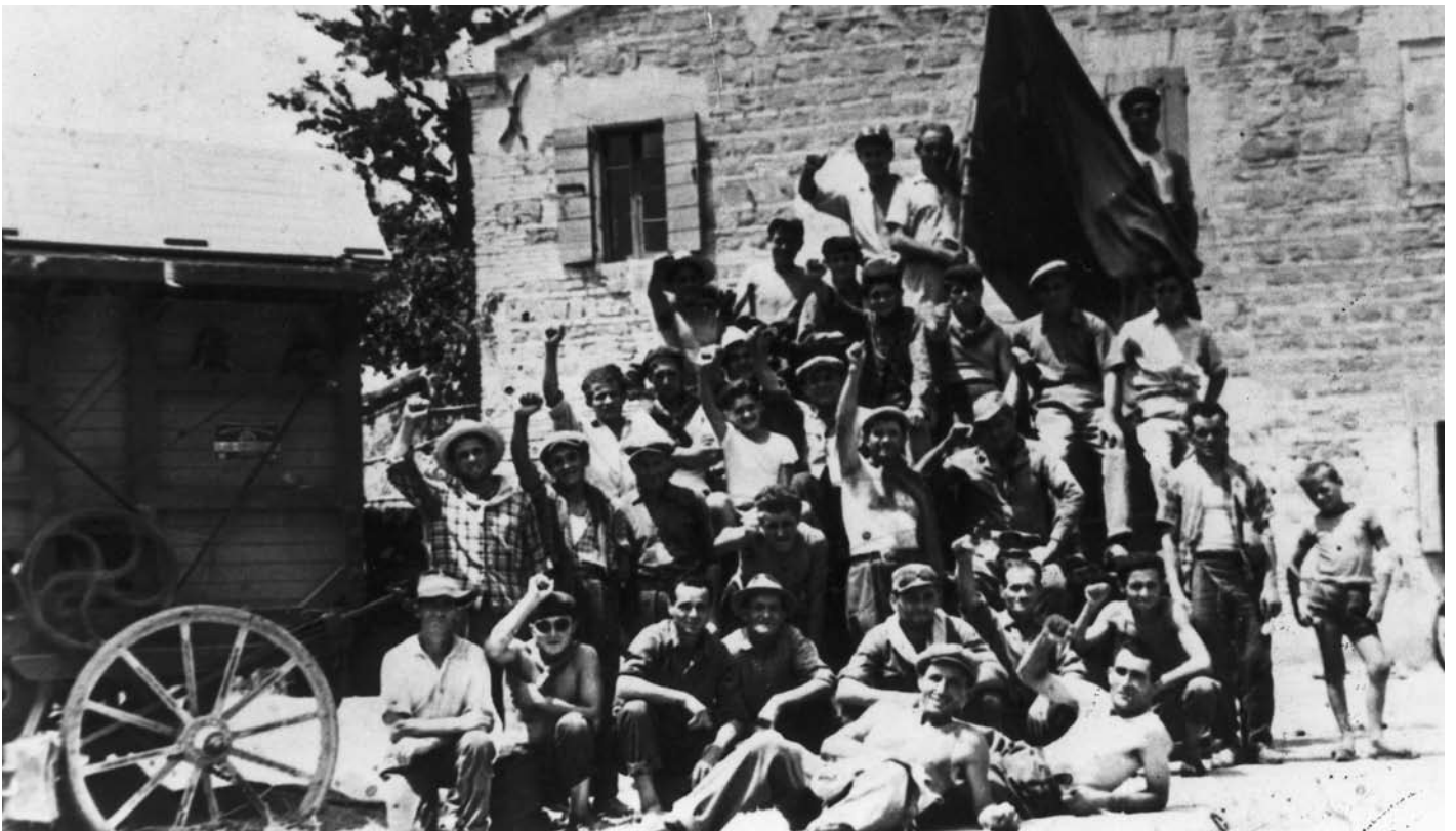
Trebbiatura del grano in un podere attorno a Pesaro, squadra d'aia in pausa. Primi anni '50.

Allora le cifre ricomposte testimonieranno che il movimento fu di popolo e contribuì anche a riscattare l'onore e il prestigio della nazione. Si continui pure a discutere e ad approfondire; nessuno può pretendere però di cancellare o di alterare verità storiche acquisite o documentate. Il fascismo,